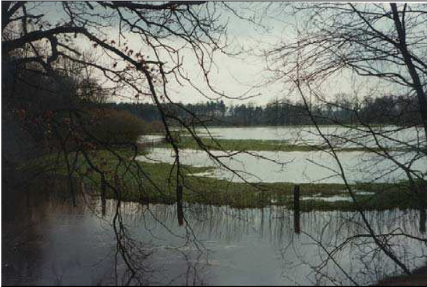
Figuur 1.4 Retentiegebied