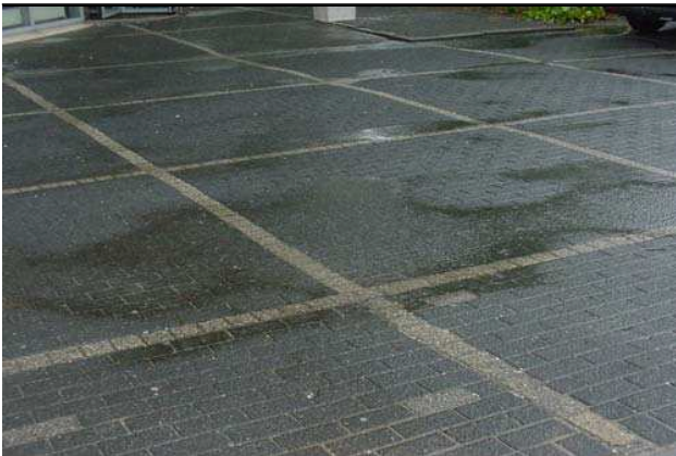
Figuur 1.5 Berging water op straat

In verband met periodiek hoge grondwaterstanden in het plangebied is infiltreren van hemelwater geen optie.