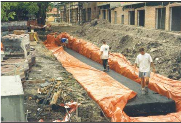
Figuur 1.2 Aanleg ondergrondse retentievoorziening