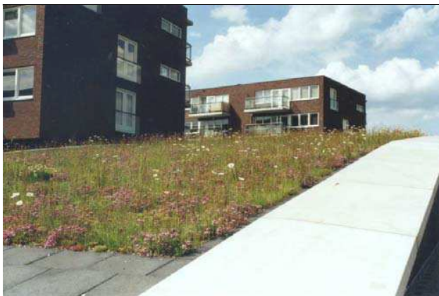
Figuur 1.1 Vegetatiedak