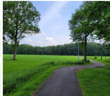
4. fietspad door het plangebied