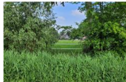
2. natuurlijke oever langs fietspad met doorkijkje