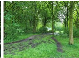
6. entree van het Hullenbos vanaf het fietspad