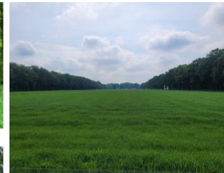
9. weids uitzicht over de weilanden richting het zuidoosten