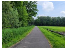
1. fietspad vanuit dorp naar Hullenbos