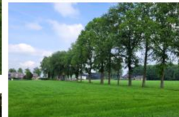
7. bomenlaan ter hoogte van Zulderveestraatweg 207