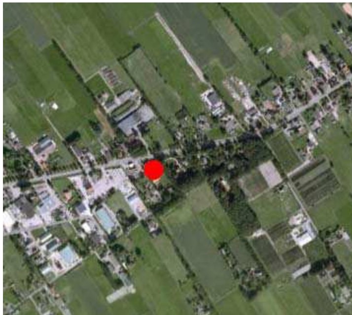
Figuur 1: Ligging plangebied

In de gemeente Oldebroek bestaan plannen om, ter vervanging van de bestaande woonboerderij op het perceel Zuiderzeestraatweg 255, een twee-onder één kapwoning te realiseren. Tevens zal er in het kader van functieverandering een vrijstaande woning worden gerealiseerd naast de woning Oude Dijk 22. De globale ligging van het plangebied is weergegeven in figuur 1.